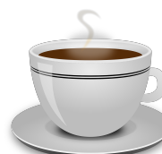
Šálka s kávou